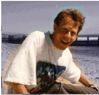
von Guido Socher ( homepage )